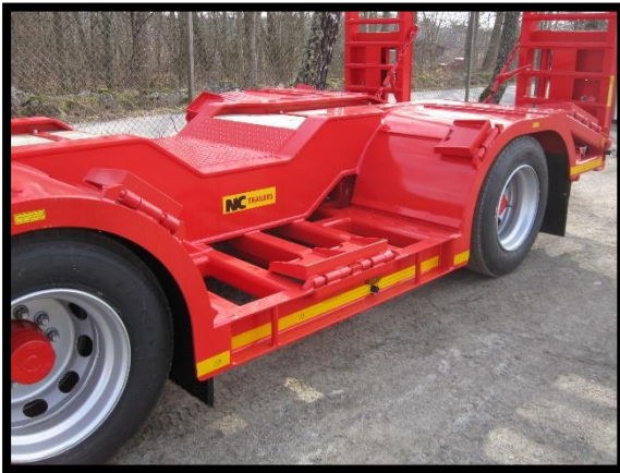
Låg ram mellan axel 2-3