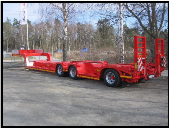
Skogsjumbo II 19,5 hjul 35 ton