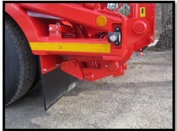
Stödben väl skyddade individuellt körda h v sida